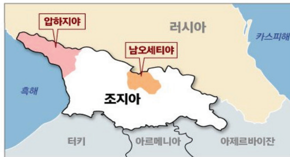
〈그림 1〉 조지아 영토

중앙일보, “전쟁만 하면 지지울 치솟는다, 푸틴이 국경선 넘는 이유.” http://n.news.naver.com/mnews/article/025/0003175803 , (검색일: 2026. 1. 13)