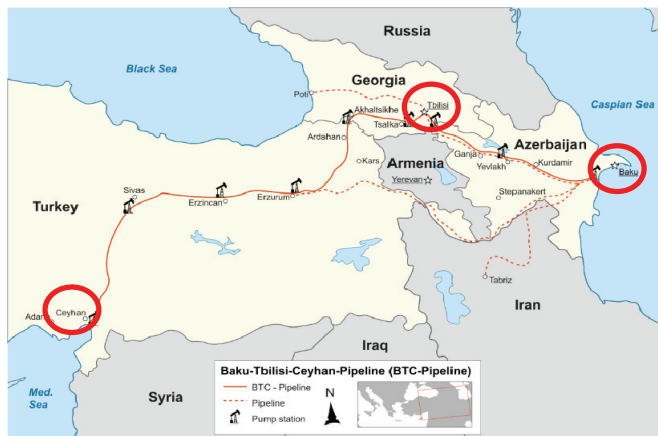
〈그림 2〉 바쿠-트빌리시-제이한 파이프라인(BTC)