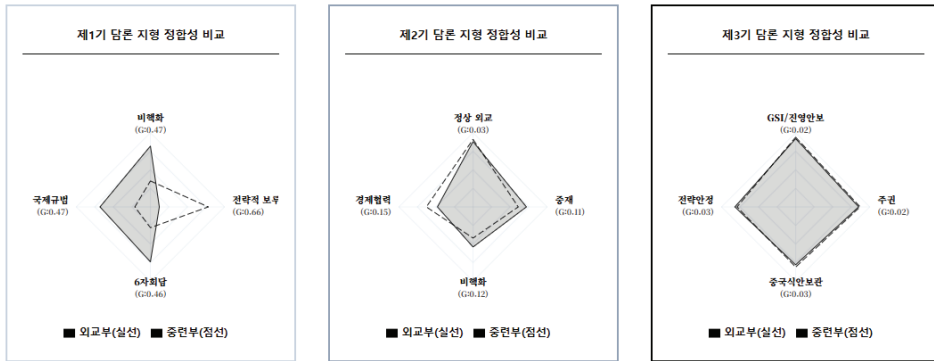
<그림 1> 시기별 부처 간 담론 지형의 구조적 동형화 추이

이므로 수렴 판단은 <표 2> 및 구조적 등가성 분석 결과와의 교차 검토를 전제로 보수적으로 해석한다.